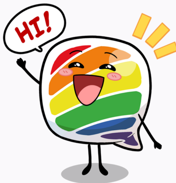
Maskot Suara Kita, Suki .

Meski dilakukan selama dua hari, suasana workshop terasa hangat, penuh tawa, reflektif, dan banyak momen “aha!” yang membekas.