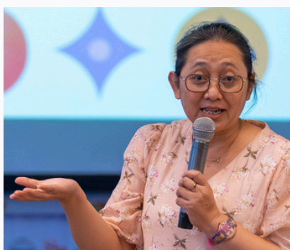
Dewi Nova Consultant Modul