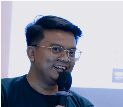
Wisesa Wirayuda Media & Campaign