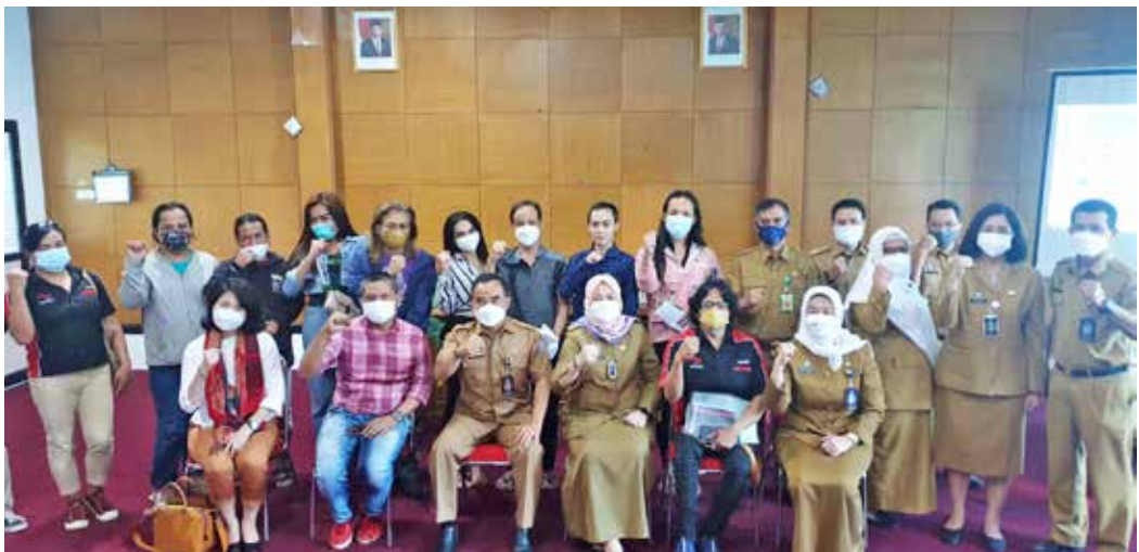
Sinergitas dan harmonisasi Disduk dan rekan-rekan transgender

Perkumpulan Suara Kita mengadakan pertemuan di Kabupaten dan Kota Cirebon dengan dua orang petugas dukcapil dan seorang perwakilan komunitas transgender pada 22 September 2021 dengan maksud memperkenalkan perwakilan komunitas