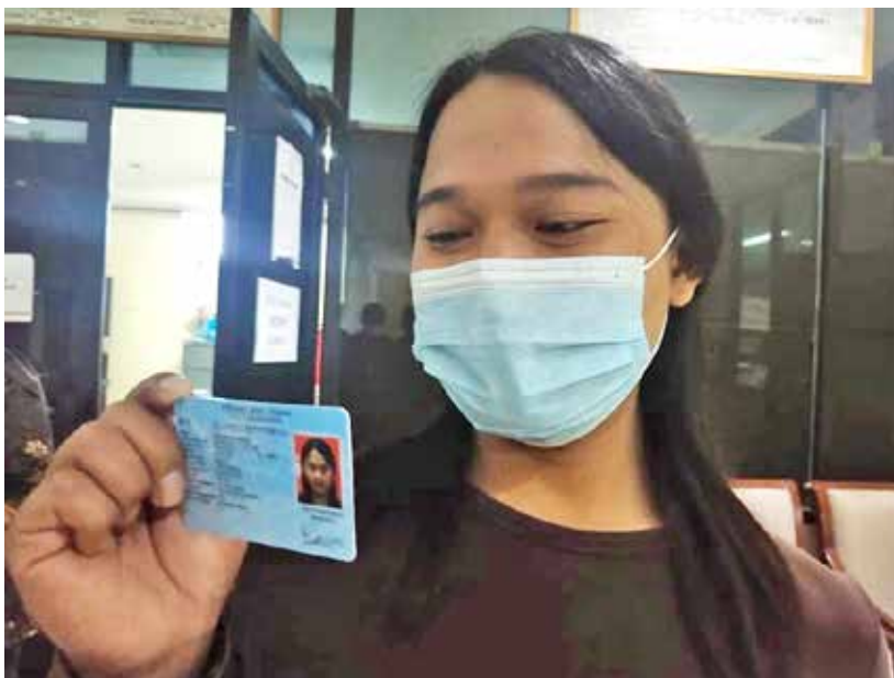
Foto 5: Transgender Kota Semarang menerima KTP saat acara uji coba 9 September 2021

dari LSM kota Semarang. Setelah rapat koordinasi, Disdukcapil Provinsi Jawa Tengah melakukan uji coba pembuatan KTP bagi komunitas transgender Kota Semarang bagi tujuh orang perwakilan transgender Kota Semarang yang difasilitasi oleh Persatuan Waria Kota Semarang, dibantu oleh Sylvi sebagai focal point pendamping komunitas.