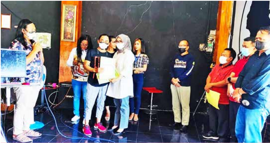
Foto 4: Acara Penyerahan simbolik KTP kepada komunitas transgender oleh Disdukcapil Kabupaten Kuningan, 19 September 2021

transgender kepada petugas disdukcapil setempat untuk memudahkan koordinasi. Pertemuan tersebut merekomendasikan adanya peningkatan pengetahuan perwakilan komunitas di Kabupaten Cirebon sehingga perkembangan pendampingan sampai dengan Desember 2021 belum berjalan dengan lancar seperti di daerah lainnya.