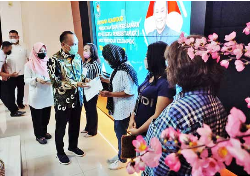
Foto 1: Penyerahan KTP dan Kartu Keluarga kepada perwakilan transgender oleh Dirjen Dukcapil, 2 Juni 2021

Pendampingan pengurusan KTP bagi komunitas transgender mulai dilakukan pada bulan Agustus 2021. Pertemuan antara perwakilan komunitas transgender dengan Disdukcapil setempat untuk proses pengurusan KTP. Bekerja sama dengan para donor individu dan Indonesia AIDS Coalition , Perkumpulan Suara Kita melakukan sosialisasi dan pendampingan di beberapa daerah di Indonesia pada periode Agustus – Desember 2021, yaitu: Provinsi DKI Jakarta, DI Yogyakarta, Jawa Barat, Banten, Jawa Tengah, Jawa Timur, Bali, dan Sumatera Utara.